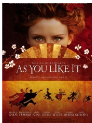
La version de Kenneth Branagh

2006 : As You Like It , réalisé par Kenneth Branagh, avec Kevin Kline