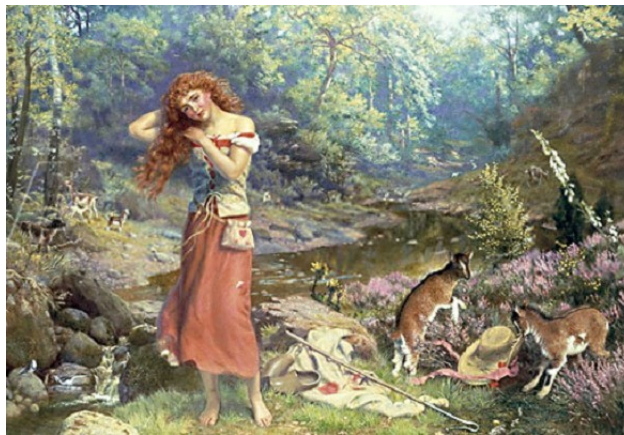
La toilette d'Audrey par Arthur Hughes

Le choix d'Orlando de combattre le chevalier Charles à la joute, malgré son inexpérience et les nombreuses victoires de l'adversaire, ne manque pas de rappeler la décision d'Hamlet d'accepter le duel truqué avec Laërte, risquant ainsi ses espoirs de vengeance. L'irréversibilité et la providence se retrouvent ainsi. Ce qui ressemble par moment à une comédie frivole et légère contient également de grands doutes et de grands tourments.