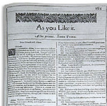
Facsimilé du premier in folio de 1623

La version du texte proposée dans cette édition est celle de l'édition originale des « Œuvres complètes de Shakespeare » réalisée par Librairie académique Didier et Cie et composée de 8 volumes et plus précisément, de la réédition de cette série, réalisée entre 1862 et 1863. La numérisation choisie est celle réalisée par « The Internet Archive » et diffusée par le projet Gutenberg.